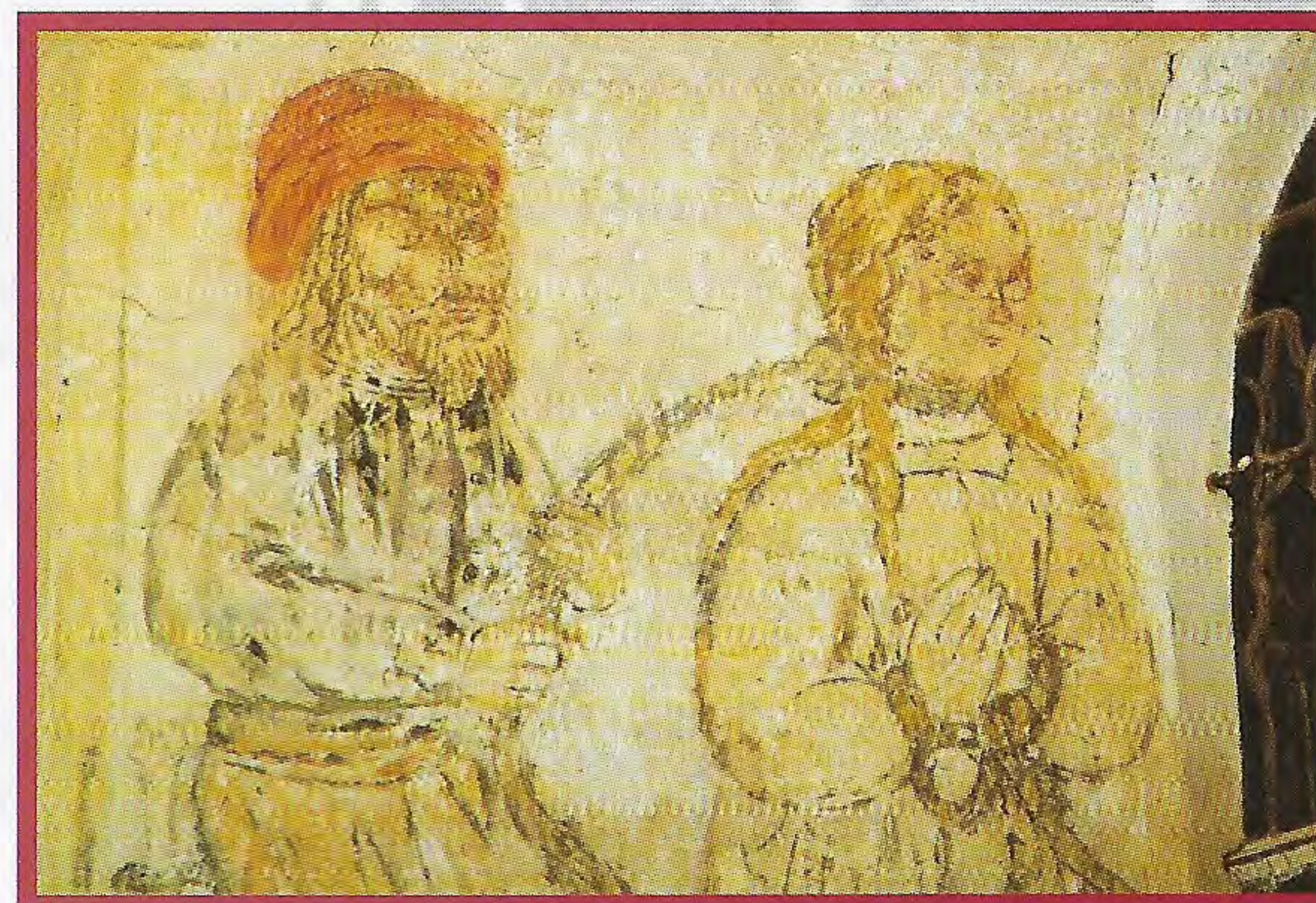
Légende du Pendu dépendu (1520) Fresque de l'église de Canville-la-Rocque

Tarif plein : 80 F - Tarif réduit : 50 F